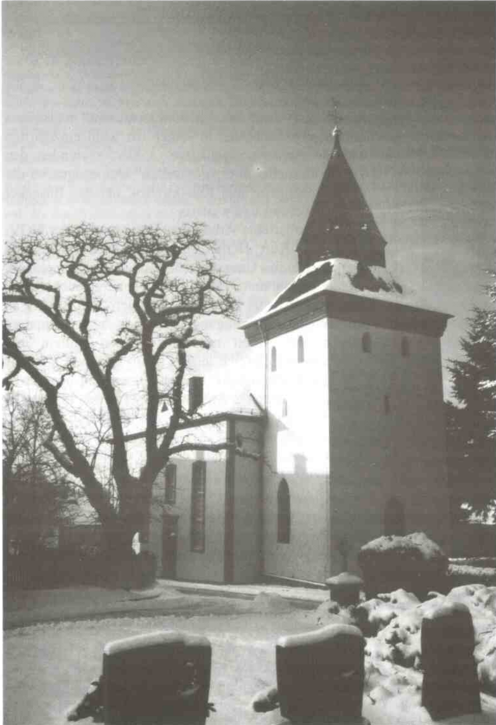
Unter den meistgewählten Motiven diese stimmungsvolle Winteraufnahme unserer Kirche

Ein in diesem Umfang nicht vorausgesehener Erfolg war die Fotoausstel-lung „Die schönsten Ansichten von Reiskirchen“. Aus mehr als 60 Großfo-tos von Kurt Herber konnten die Besucher die nach ihrer Meinung schönsten auf einem Kärtchen ankreuzen.