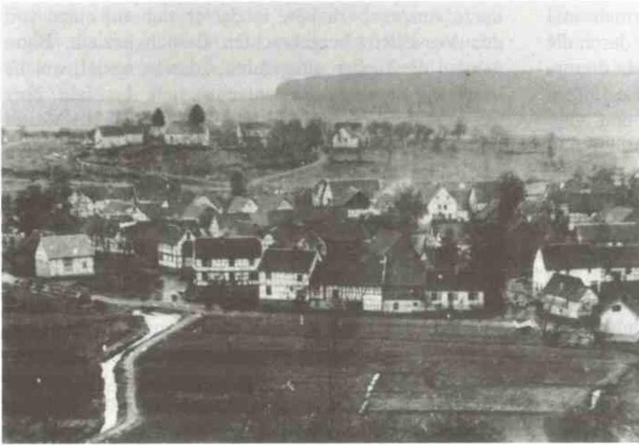
Alte Ansichtskarte mit Blick auf den Ortskern von Saasen

Bahnhofes Saasen kommt von rechts das Wasser der Hauptquelle dazu, die am Wingert entspringt. Auf der erwähnten Karte 5419 Laubach ist westlich von diesem Zusammenfluß dem eingezeichneten Bachlauf das Wort „Wieseck“ beigeschrieben. Im Frühjahr, bei der Schneeschmelze, bringen die sonst trockenen Rinnsale aus dem nördlichen Staatsforst erhebliche Wassermengen in das Tal. Zwei Wasserwerke, die nie den Reichtum des Grundwassers dieser Gegend ausnutzten, gab es bei der Quelle in Saasen. Das eine versorgte Saasen und Veitsberg, das andere Wirberg und Göbelnrod. Es lag unterhalb des Wirbergs. Dort muß früher ein See gewesen sein, denn diesen oberen Teil des Wiesecktales nennt man heute noch den „Si“. Auf der Flurkarte sind die tief liegenden Wiesen noch als „Moorwiesen“ ver-